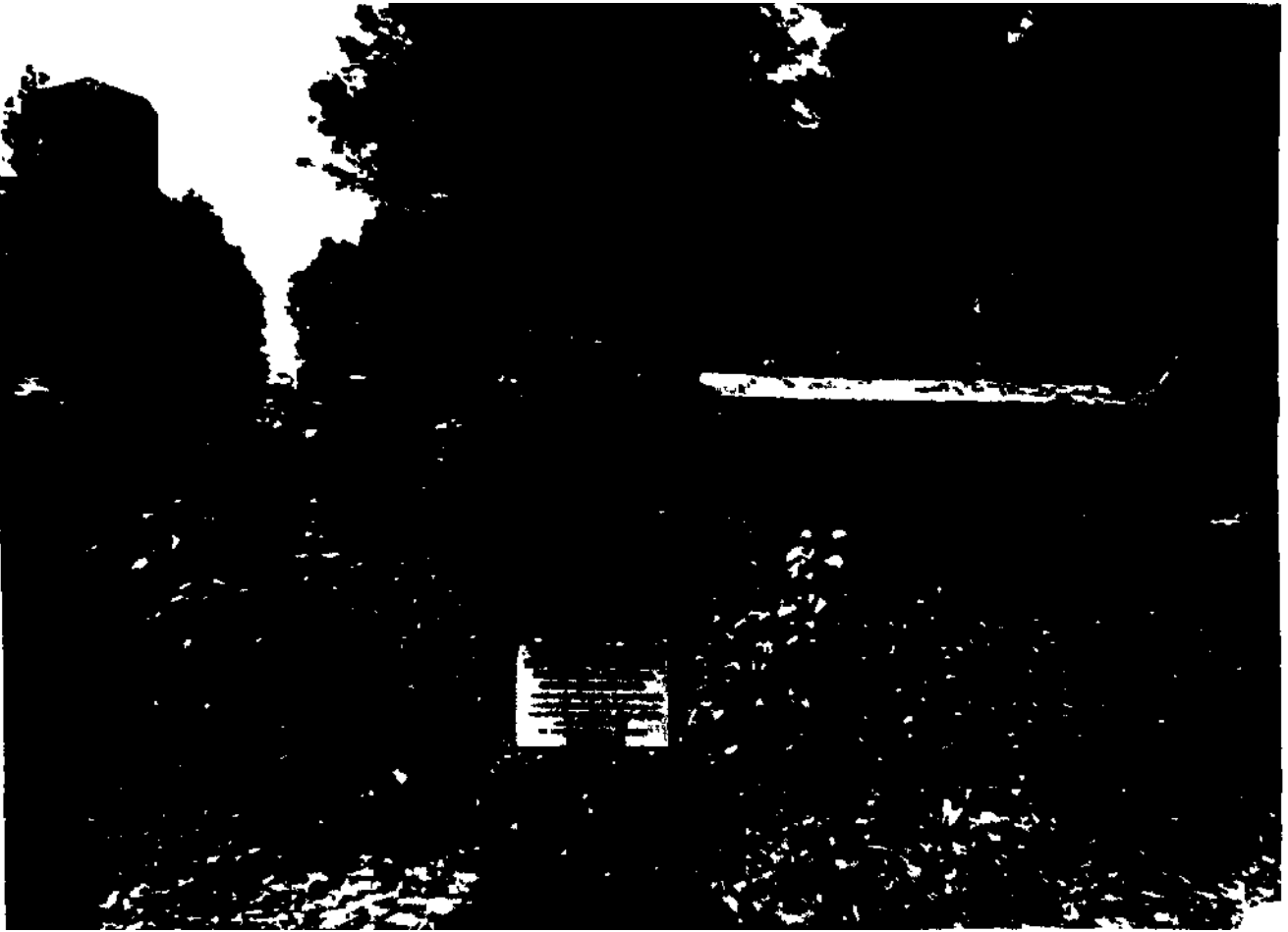
Gedenktafel am Hadersdorfer Friedhof im Sommer 1945, errichtet durch die KPÖ. Sie wurde nach der Exhumierung der Toten im Frühjahr 1946 nicht mehr aufgestellt.